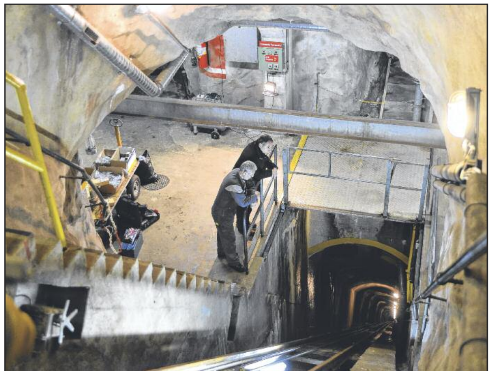
Vertigineux: le funiculaire souterrain reliant les forts de Dailly et Savatan est incliné à 102%.